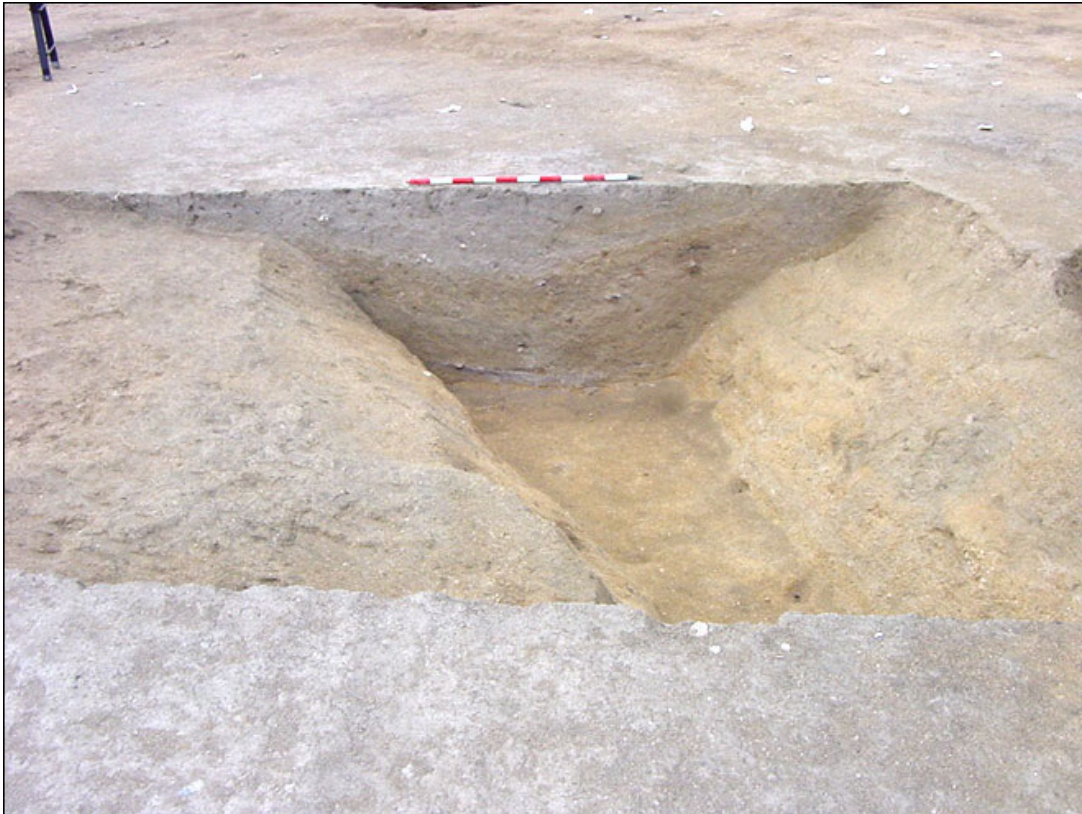
Excavated part of a channel or settles circular that surrounds the town