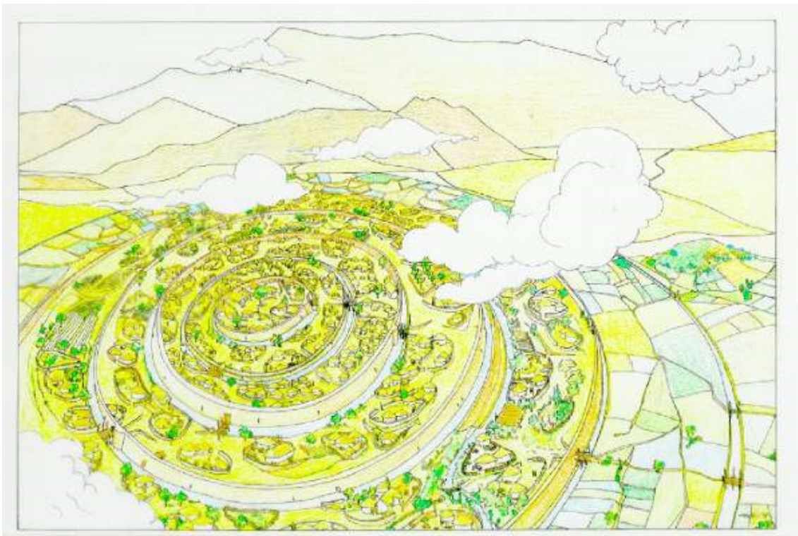
Drawing of Marroquíes Bajos reconstruction. Author: Narciso Zafra , archaeologist of the Department of Protection of the Historical Patrimony of the Delegation of the Council of Culture of the Province of Jaén. http://www.promojaen.es/pit/fotos/44P4.JPG

“La antigua Jaén, una ciudad prehistórica de Andalucía similar a la Atlántida de Platón”