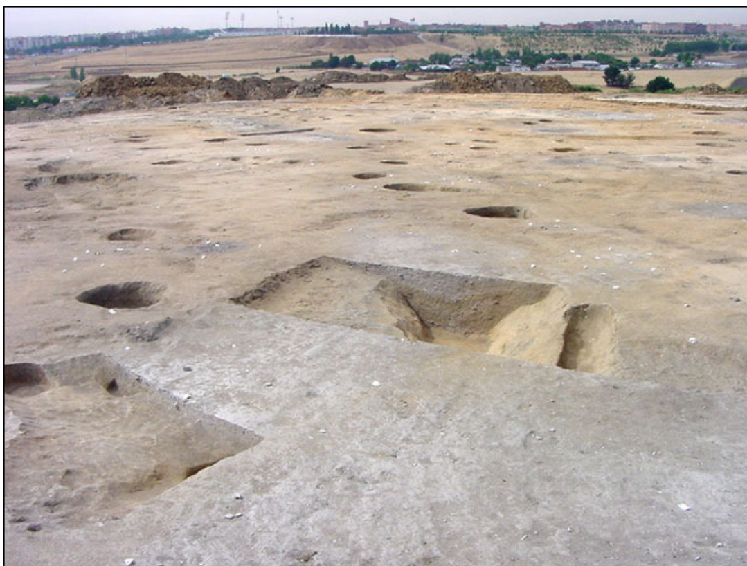
General Vista with Madrid to the bottom

With this new discovery confirms theory of Georges Diaz-Montexano that during ages of Copper and Bronze , his used in several points of island or peninsula of Iberia design of cities circular concentric with channels and pits circular which they surrounded to the city or town located in a central island, that is the same architectonic design of the concentric city of Atlantis , according to appears described in the dialogue of the Plato's Critias . In this concentric town have been numerous examples of beautiful ceramics painted of several colors, between which it emphasizes the red one, the black and the colors clear, white and yellow pale; tools and utensils of copper, bronze, pedernal, bone and ivory. As it details peculiar emphasizes used stamps or seals to mark the ceramics with the image of a marine divinity of man with fish body, similar to tritones, and that it could be a symbol of the God Poseidón .