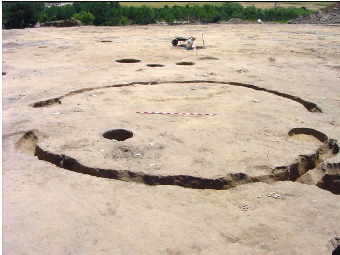
Detail of the foundations of a circular enclosure with several wells